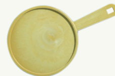
218 - cadres

'89 Le produit brut dans la perle passe du PVC au PE