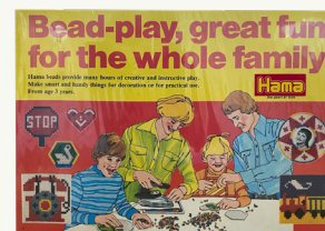
561 - Première boîte