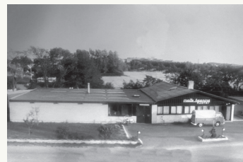
1971 - Ringvejen 51, Nykøbing Mors