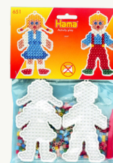
651 Le système de presse